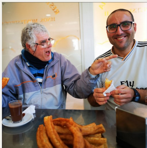
Desayuno entre amigos