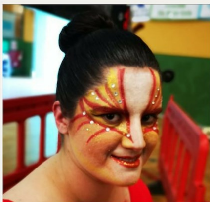
Reina del Carnaval